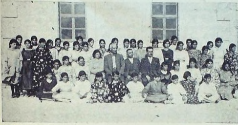
Eti Ulus okulları dersanelerinden bir grup