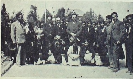
Ulus okulları belge dağıtma töreninde kadın talebeler

Türklük, Anadolunun cenubunda ve Hatayda bıraktığı Eti kolunu dünün köhne mezheb dedikodularına feda edemezdi. Şimdi bu ırkdaşlarımızı mezhebinden ve yabancı dil konuşmalarından bahsedenlere kahve dedikodularını bir tarafa bırakarak biraz da ilim ve tarih ile meşgul olmalarını tavsiye ederiz.