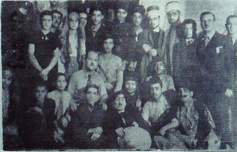
Bir Temsilden Senra

18 - 24 İkinci kânun geceleri: Kanun adamı ve Tavsiye mektupları Halkevi salonunda temsil edilmiş ve bütün bu temsillere 6000 kişiden fazla vatandaş gelmiştir.