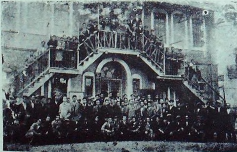
Motor Kursuna Gelenler

4 — Dershane ve kurslar şubesi şehrin büyük 15 gazinosunda 105 konferans vermiş, bu konferanslarda inkilâp hareketlerini 25 binden fazla halk dinlemiştir.