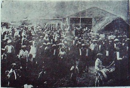
Bir Köy Gezisinde

2 — Numune köyünden İncirli köyünün krokilerinin tamamlanmasına çalışılmış ve Zeytinlu köyünde iyi bir içme Arteziyen kuyusu açmaya ön olmuştur.