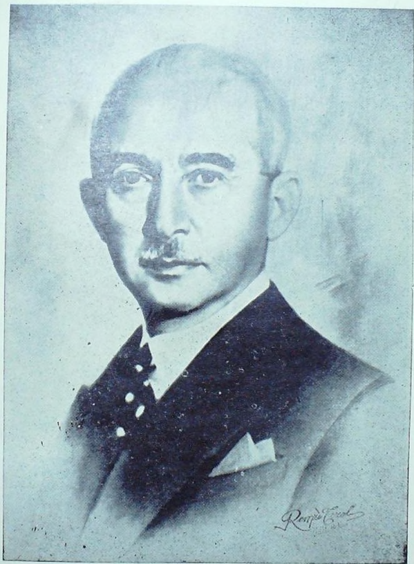
Halkevlerimizin Koruyucusu Millî Şefimiz İSMET İNÖNÜ