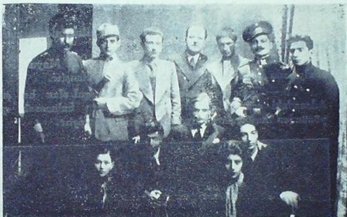
Bir Temsilden Sonra