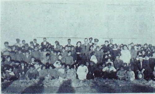
Akkapı Okulu Tâlebeleri

Merkezi Ankarada olmak üzere Seyhan ve Içel vilâyetlerinde teşekkül eden ( Hars Komiteleri ), bu iki vilâyette yaşayan ve Arapça konuşan otuz iki bin ( Eti Türk ) ünün öz benliklerini tanımaları, ana diline dönmeleri ve Türk kültürüne karışmaları için bu soydaşların kesif buldukları köylerde ve mahallelerde okullar açmakta ve diğer Türk yurddaşları ile ailevi ve içtimâî münasebetler tesisine şuurdu bir katkıya yaratmaktadır. Bölgemiz hars komitesinin çalışmalarından millî dıyğula-