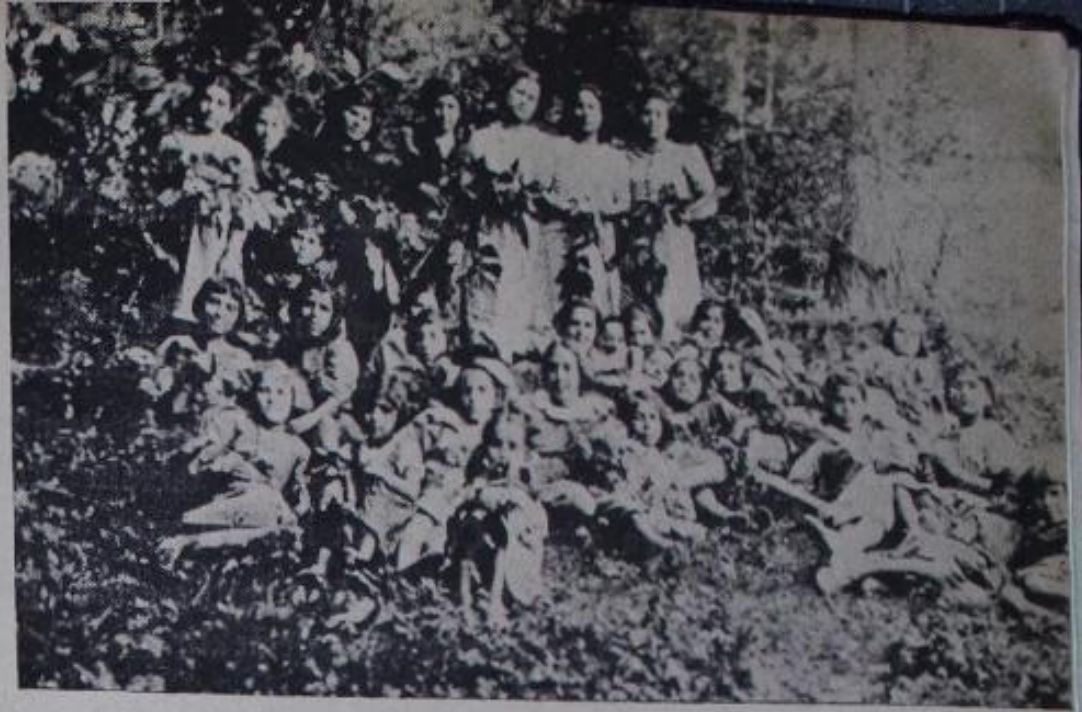
Çocuklarımız Bürücek kampında...

alınan yavruların körpe vücutları az zamanda serpilmiş ve gelişmiştir.