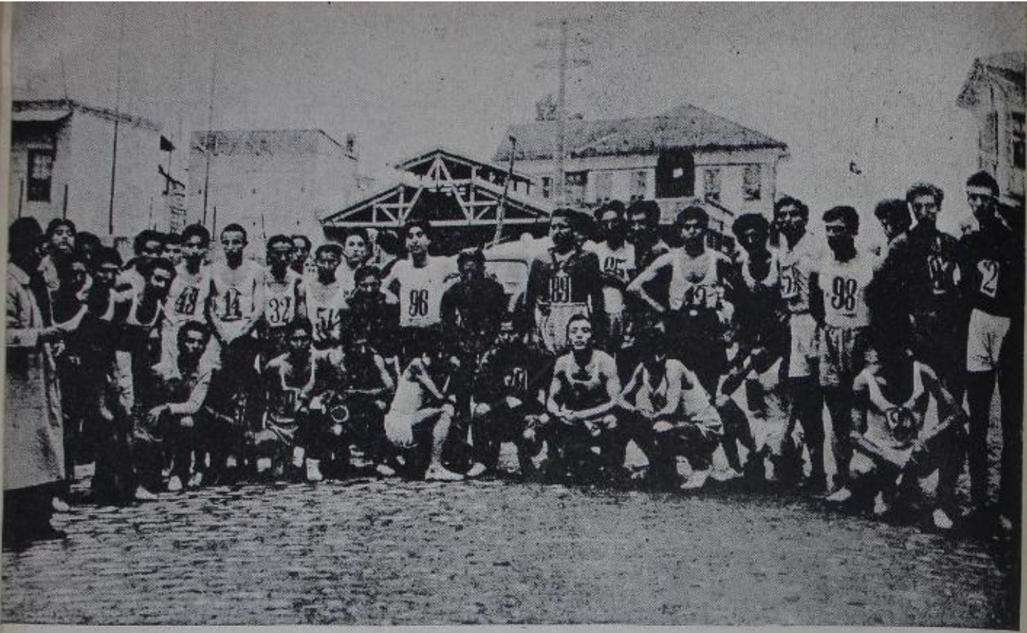
Evimizin tertip ettiği Atatürk koşusuna iştirâk eden koşucularımız hareketten evvel grup halinde..