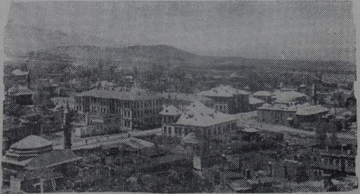
Şimdi bir harabe haline gelen eski güzel Erzincan

“Harabeleri mamûre haline getireceğiz,, bu muhakkaktır. Fakat yapamayacağımız bir tek şey : Kaybettiğimiz yurttaşları