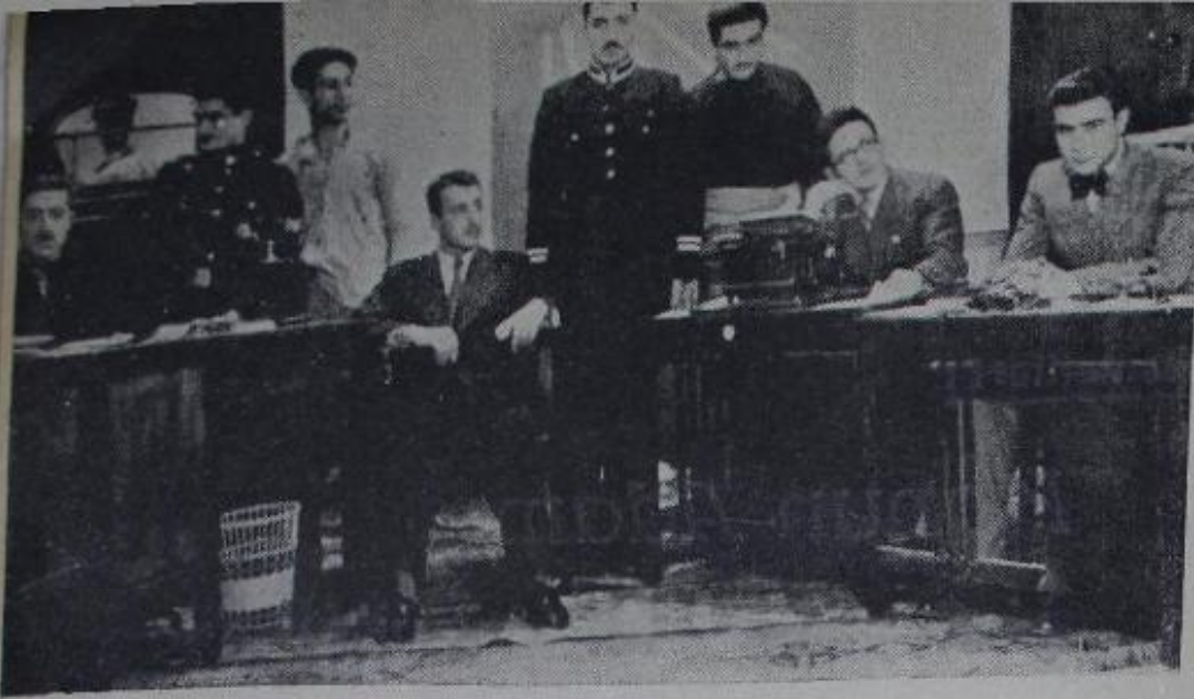
(Kanun Adamı) ndan bir sahne...

dir. En yeni eseri olan "Beyaz Baykuş,, C. H. Partisi piyes müsabakasında en iyi dereceyi kazanmıştır.