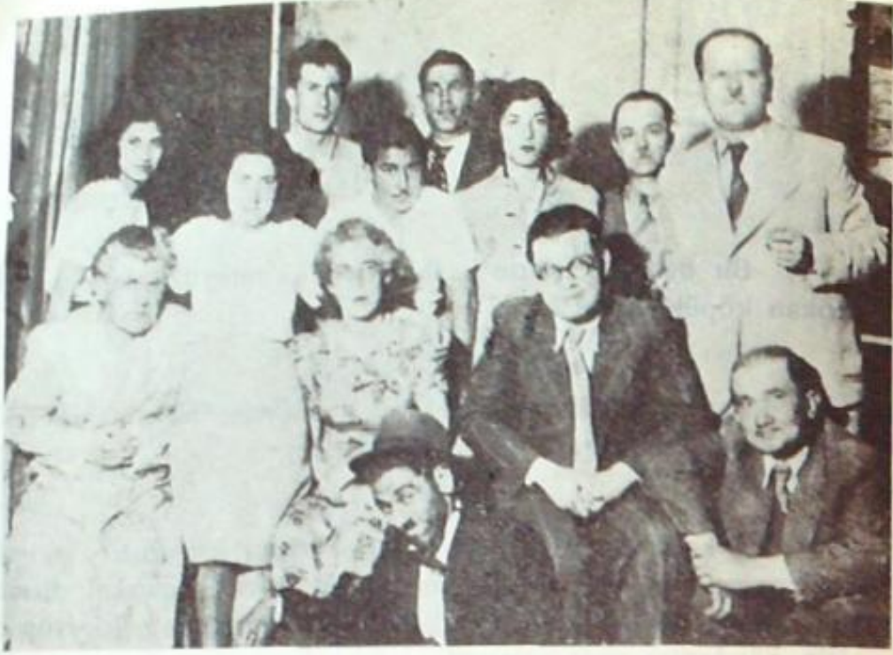
«Kavga Sonu» Komedisini Oynayan Halkevi Gençleri.