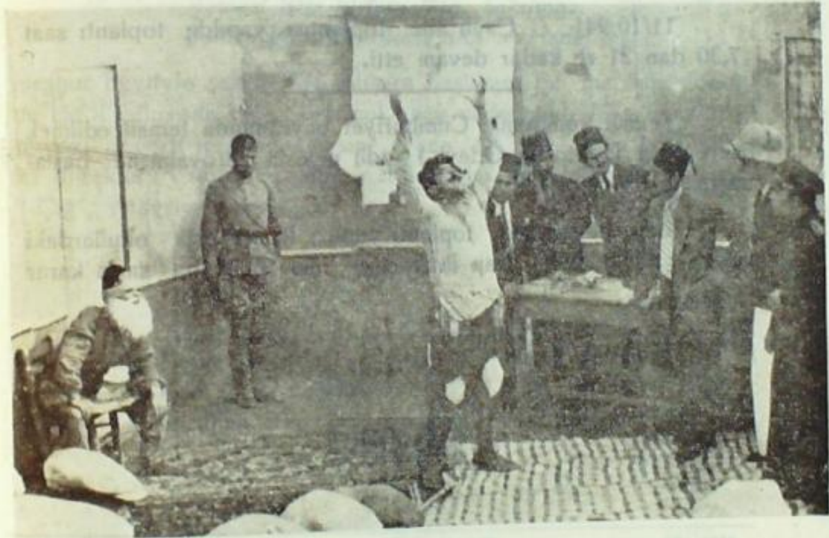
Evimizin gençleri İstiklâl temsili esnasında