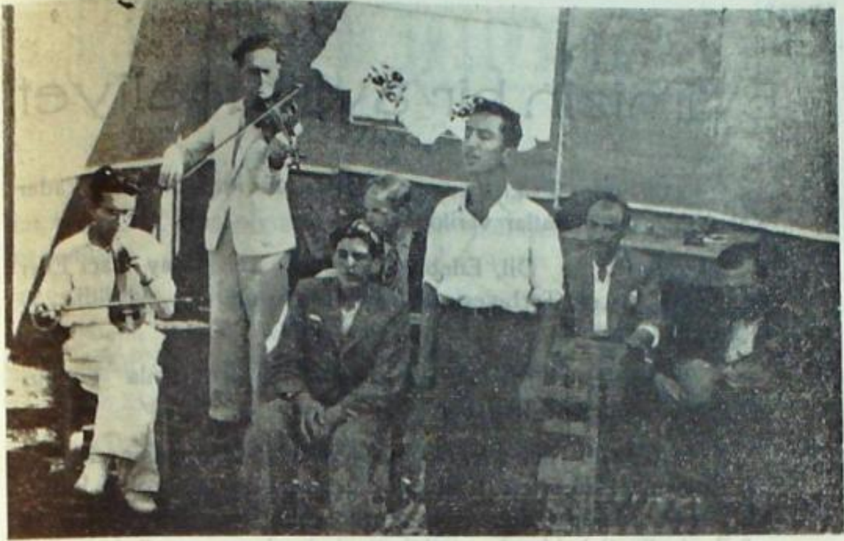
Evimizin Müzik kolu gençleri bir konser verirken