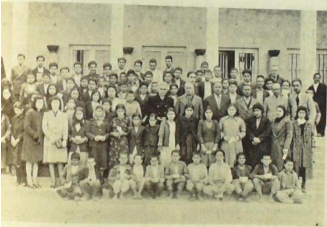
Evimiz kurslarından mezun olanlar Halkevinin önünde öğretmenlerle beraber