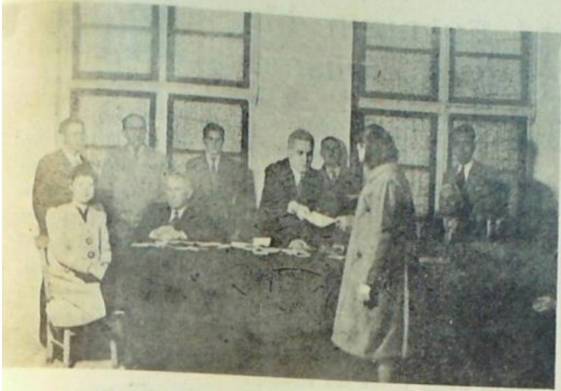
Evimiz kurslarından mezun olanlara vesikaları verilirken ]