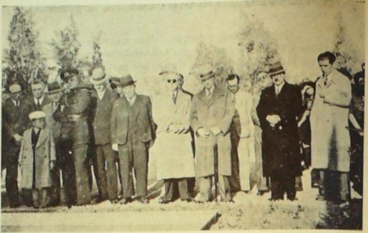
15 Mart Atatürk gününde parkta yapılan törenden bir görünüş