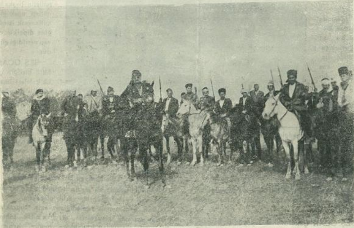
Millî kıyafetlerle Çukurovalı Kahramanlar

Adanın evlâtlarını böyle coşturan, ölümle boğuşturan sebepleri bizzat kör ve kinci düşmanlarımız hazırlamışlardı. Türkün inandığı ve tanıdığı mukaddes mefhumlara karşı nasıl bir ruh ve vicdan bağlılığı duyduğunu bilmeyenler doğrudan doğruya onun bu manevî cephesine taarruz etmişlerdi. Bu gafiller az zaman sonra siyasi ve millî varlığın bir zerresini bile feda etmeyecek olan bu ülvi varlıklar uğruna ölümü dahi yenmeğe azmetmiş olan Çukuro-