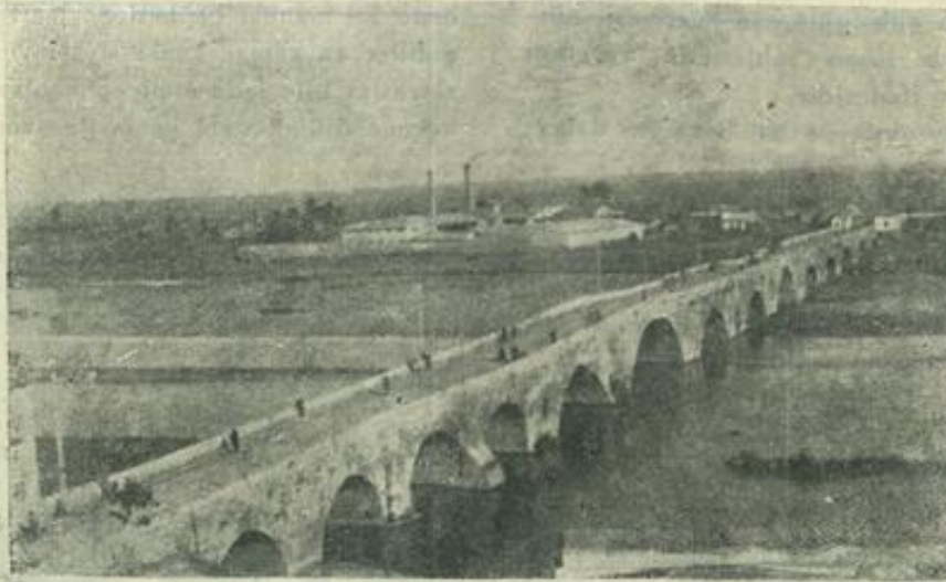
Adananın Tarihi Taş Köprüsü

Hürriyet için çarpışmış ve dünyaya örnek olmuş medeni bir milletin başka bir millete layık gör-