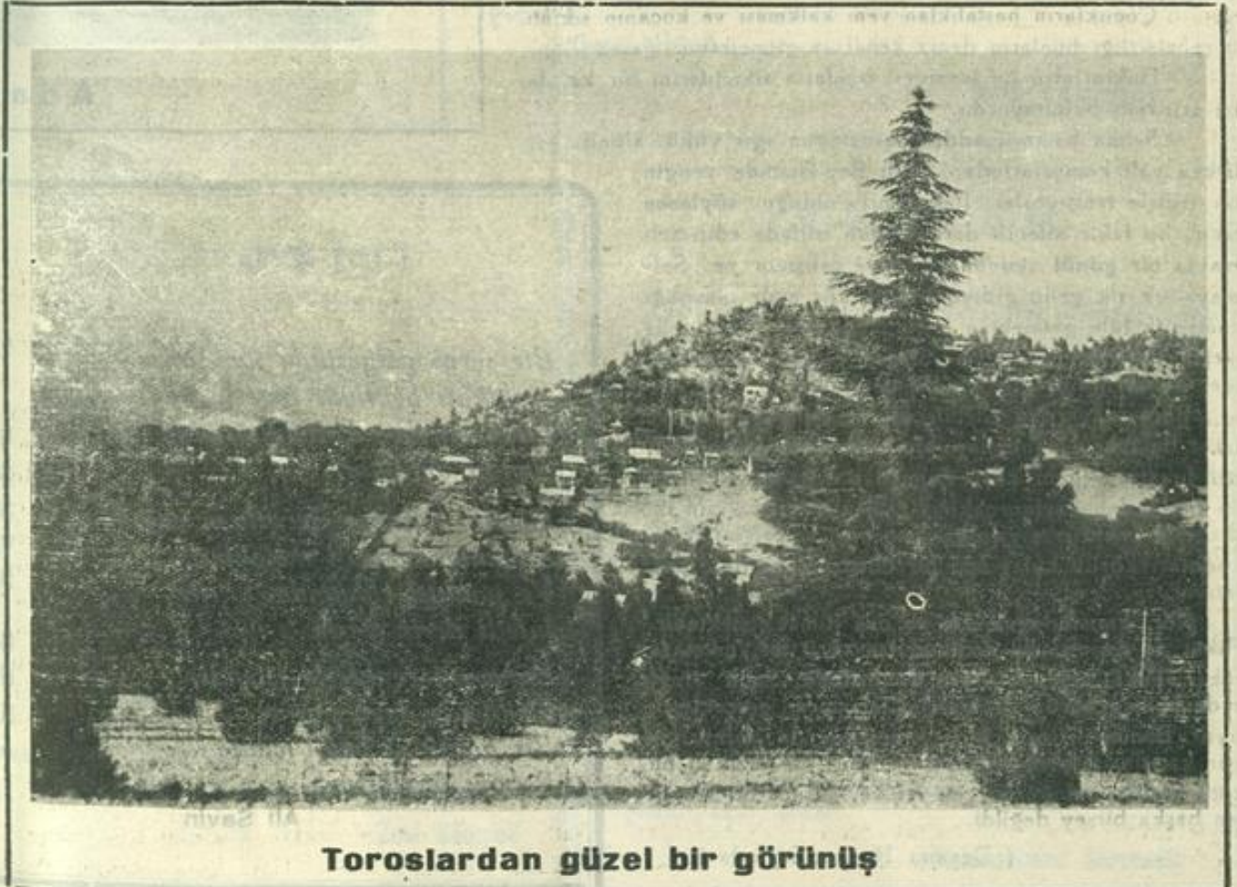
Toroslardan güzel bir görünüş