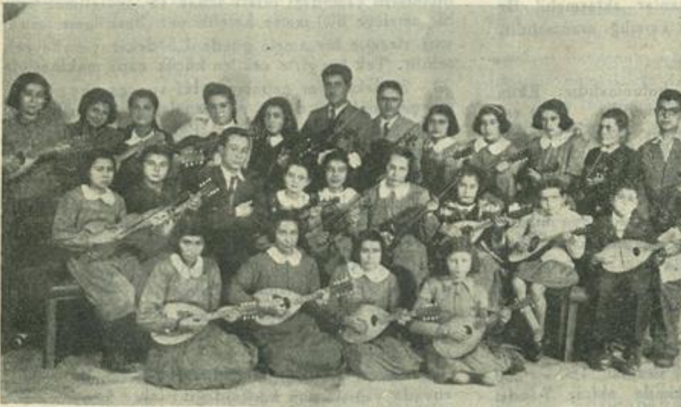
Halkevi Müzik Öğrencilerinden bir Grup

Halkevleri Müzik ileri hareketlerinde başlıca âmil-