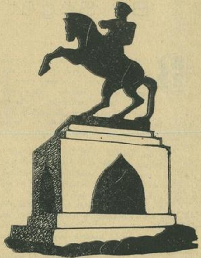
Samsunda Atatürk Abidesi

ve asil bir millete ihtiyacı vardır. Olanesini bilen bir millet ölmez; ebedidir. Türk milleti haritayı â lemeden kaldırılmıyacaktır.