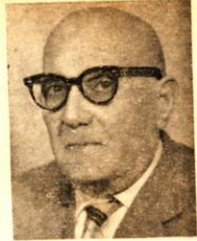
Ali Ulvi Elöve.

"DAĞ BAŞINI DUMAN ALMIŞ" Gençlik Marşımızın güfte yazarı sayın Ali Ulvi Elöve'yi, Yeşilyurt'taki evlerinde ziyaret ettik. 87 yılın ağırlığı omuzlarında ahlâyla oflayarak karşıladı bizi. Rahatsız ederiz diye endişemiz varken, ziyaretimizden memnun kaldığını hemen belli etti. Konudan konuya atlarken ne ahlâması kaldı, ne de oflaması. Kulakları ağır duyuyordu, gözleri iyi görmüyordu. Bir de, arada duraklıyor, "ne diyordum", "nerde kaldıydım" sorularıyla özür dilercesine gözlerimizin içine bakıyordu. Yarım yüzyılı aşkın öğretmenliği, şairliği, yazarlığı ve hepsinden önemlisi dilbilgini olarak ulusumuza yaptığı büyük hizmetleri hiç önemsemiyor, her fırsatta "Ben ne yaptım ki, bütün bun-