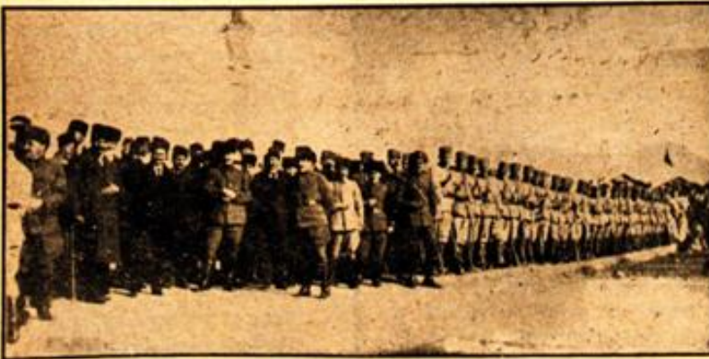
5 Ocak 1922...

Bu ruh, bu şahikalaşmış güç, düşmanın ortaya sürdüğü en kudretli kumandanların akıllarını başlarından alıyordu. Onlar, o zamana kadar, dolma tüfekte top susturulduğunu, pala ile tanklara, zırhlı otolara karşı durulduğunu ne görmüşler, ne de işitmişlerdi. İhtiyarı, hastası, kadını, çocuğu ile bir milletin ayağa kalkışını, dağ çocuklarının, köy kâhyalarının, sırma apoletli generalleri dize getirisini havsalları alıyordu.