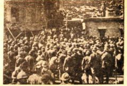
İşte, Menli Taburu. 26 Mayıs 1920'de Toros Dağları'nın Karbogazı geçidinde 40 çeteye esir düşen Fransızların meşhur Menli Taburu, Bucak köyünde görülmektedir.