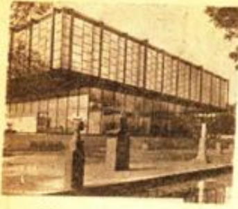
Viyana 20. Yüzyıl Müzesi