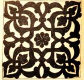
(Şekil 1) M. Batur (Duvarları süsleyen karo çini)

Türbesinde, İstanbul'da Çinili Köşk'te bulunur. 16. yüzyıl tez-yinatında çok görülen bu dekor, teknik bakımdan sır altı ve mozaik olarak Selçuklu an'anesini hatırlatır.