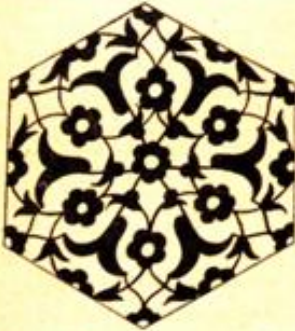
(Şekil 2) M. Batur (Türbede duvar ve sandukalar üzerindeki altıgen çini.)

Yeri : bugün "Ziya Paşa Parkı" denilen yerde, kendi dış avlusundadır. Ağaçlar arasında güzel bir görüntüsü vardır. Mihrap önünde bulunan tek kubbesi dıştan oldukça sivri ve yüksektir. Kurşunla kaplıdır. Dört boğumlu alemlerle daha da zarıflaştırılmıştır. Tanbur kısmı çok yüzlü ve yüksektir. Buradan açılan yuvarlak kemerli pencereler camii aydınlatır. Pencere üzerinde ve aralarında koyu taştan kuşak ve zen-