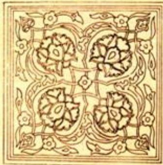
(Şekil 3) M. Batur (Duvarları süsleyen bir başka çini)

İç kompozisyonu ; ortada birbirine bağlanan dört nar çiçeği hatayinin içleri mavi, yeşil ve kırmızı dolguludur. Ara bağlantı dalları açık mavi renklidir. Bunlar, kırmızı benekli rozet çiçeğe saplanır ve aksi yönere yeşil yapraklar çıkar. Nar çiçeklerinin aralarında, içleri yeşil dolgulu sarı dört büyük rumi, bu karoyu kompoze eder. Etrafını 1 - 2 cm. genişliğinde sarı, mavi ve firuze bir şerit çerçeveler. Bu tip veya devir çinileri Bursa'da Yeşil Cami ve