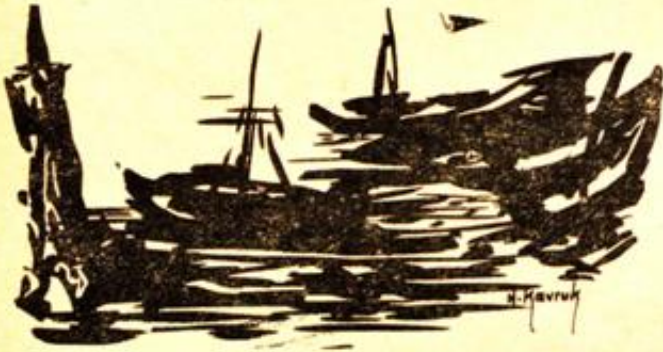
Desen : Hasan Kavruk