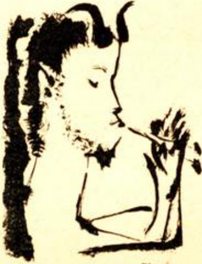
Dosen : Picasso