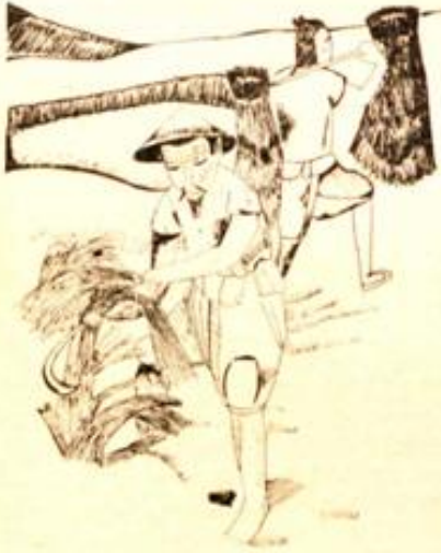
Desen : Ali Erkin

Kazmaya sarılıp hadi bigayret Şu yaban otların kökünü kazımalı Arta kalan tohumlarda bereket Heyt! Hehey!