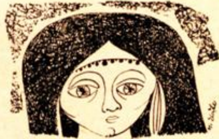
Desen : Metin Eoğlu

Tıktıkların sahibi için çekerek uzaklaştı. Karanlık sokaklardan ışıklı bir caddeye çıktı. Renkli mağaza vitrinlerine baka baka yürüdü. Çocuk eşyaları, bebek elbisele-