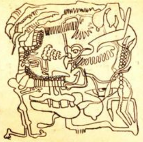
Desen : Mine Özyılmaz

Mehmet Ağa, yaptığına, yapacağına bin kez pişman olmuştu ama, iş isten geçmişti çoktan. Düpedüz kör etmişti, az önce zavallı çocuğu... Elinden istemsiz fırlayan o kahrolası değnek, beş - on metre uzaklığa karşın, nasıl da gidip bulmuştu, bulabilmişti Sami'yi? Sami'nin gözünü? Şaşıyordu buna. Nişan bile alsaydı, bu denli rastlantı sağlayamazdı doğrusu.