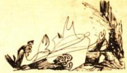
Desen : Hasan Kavrak

Anlamsız şiir yazmak bir yana üstelik her şair kanımızca biraz düşünür de olmalı. Ve de düşünüsünü bildiğimiz belli düzenin dışında özümlemesini, bir komprime haline getirmesini bilmesi gerek. Akıl denetimini hiçe sayıp, türlü çağrışımlarla bilinç altına başıboş düzenini (otomatik yazı) ile kâğıda çizdirmek şiir olamaz. Ne olursa