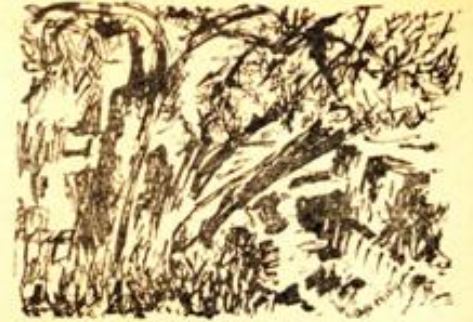
Desen : Ayşe Ersoy