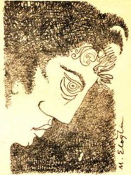
Desen : Metin Eloglu

Herseye o denli bağlıydı ki, ölümünden az önce, bana bir takım "vasiyetler" etmişti. Hep sevdiği insanlara ait. Birinin askerlik işi, birinin geçim derdi, birinin hastalığı, yurd dışına kaçma çabası, başına musallat olan belâli kabadayılar, bir kızın