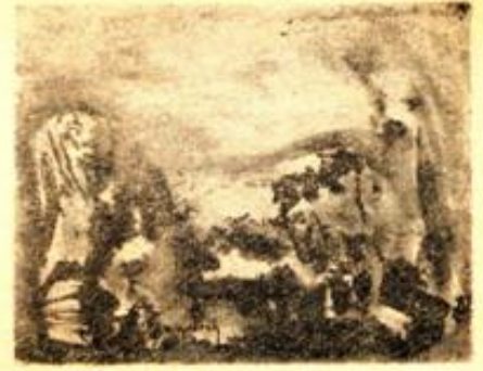
Desen : Hasan Kavruk

Anlaşılan, Büyükanana bütün geleneklerden kurtulmuş, sonuna yaklaşan yaşamına başka, yeni yollar seçmiş. Babam şakacı, anlayışlı bir adamdı, kızmadı anasına;