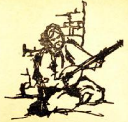
Desen : Mehmet Demirel

II — Bozuk düzene başkaldırma, adalet-sizliğe, haksızlığa, gericiliğe karşı direnme dünümüzün şiirinde yok mudur? Bir Dadaloğlu'nun , bir Dertli'nin erkek sesleri hâlâ, yankılanmaktadır.