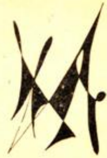
Desen : Vedat

"Arkadaşların sancısı - ilk durumda, eylem alanımız olan tiyatromuz üniteleri - ekono-