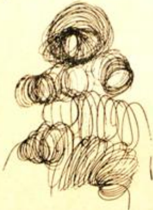
Desen : Ömer Uluç.

Orta kuşağın bu özgün sanatçısı, son yapıtlarını GALERİ I'de sergiledi. 45 tablolu bu gösteride, tümü de non-figüratif çalışmalar yer alıyordu. Bu kez - öncekilerden ayrımlı olarak - özellikler, değişimler vardı Uluç'un resimlerinde: Yine sogan renkleri yoğunluğuna karşın, tekdüzelikten bir arınış var. Ayrıca, sıcak renkleri de deniyor seyrekçe; o kıymetli leke düzeni içinde ilginç bileşimlere varıyor. AK-KARA'larındaki dengesel yapıya da aynı motifel eğilimlerini uygulamış. Ne ki, bunlar - renkli duyurum güçleri olmadığından - cılızlaşıyor tüm sergi yoğunluğunda, bir "desen" niteliğine bürünüyor giderek. Çoğu, "çerçevesiz tablo" tutkunlarının pek ısınmayacağı türden. Alabildiğine özgür bir "biçimsel estetik" i