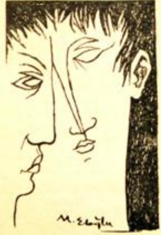
Desen : Metin Eloğlu.

Adam, bahçeli lokantanın dip tarafında bir masaya gelip oturdu. Oturmaya birlikte neden bu lokantayı, bu lokantada özellikle bu yeri seçtiğini düşündü. Neden ama burası? dedi kendikendine.. Yıllardır bu lokantaya gelmemişti. Kadın arkadaşı, telefonda, buluşmak için bir yer sorunca, burayı söylediğini anıdı adam.