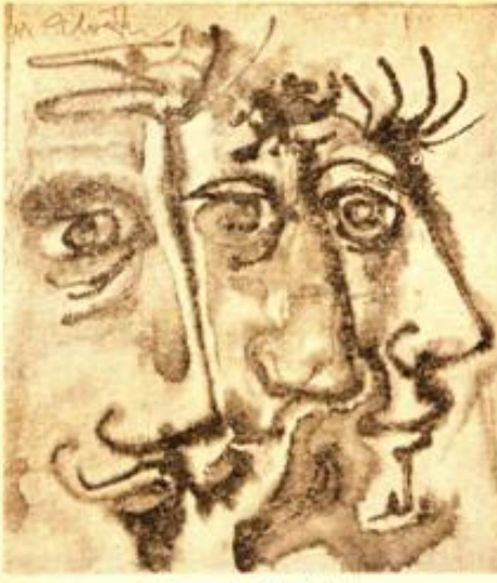
Desen : Metin Klogtu

Çoğumuz dar görüşler içindeyiz. Nice aydın dediklerimizin yargularına bir bakın, sizi acılara sürükleyen tutarsızlıklar göreceksiniz. Adam, beyin körlüğü içindedir. Doğruyu düşündüğünü sanır. Oysa doğrularla çatıştığının bilincinde değildir. O söyler, siz dinlersiniz. Bir sıkıntı girer içinize. Konuştuklarından çıkaracağınız sonuç bir hiçtir. Bir sürü yanlışlık, bir sürü gerçek dışı sonuçlamalar... "İlle de bu böyledir" deyip geçerler. İşte yanlıya düşülen yer burası. Bir de bakarsanız, o düşünce çoğumuzda bağdaşmıyor; gerçeğe dönük olma niteliğinden yoksun, eski, donuk, güçsüz, bir yenilik getirme özelliğinden uzak. Böyle olun-