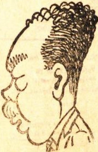
FALİH RİFİKİ ATAY Akrep misali olan patron: