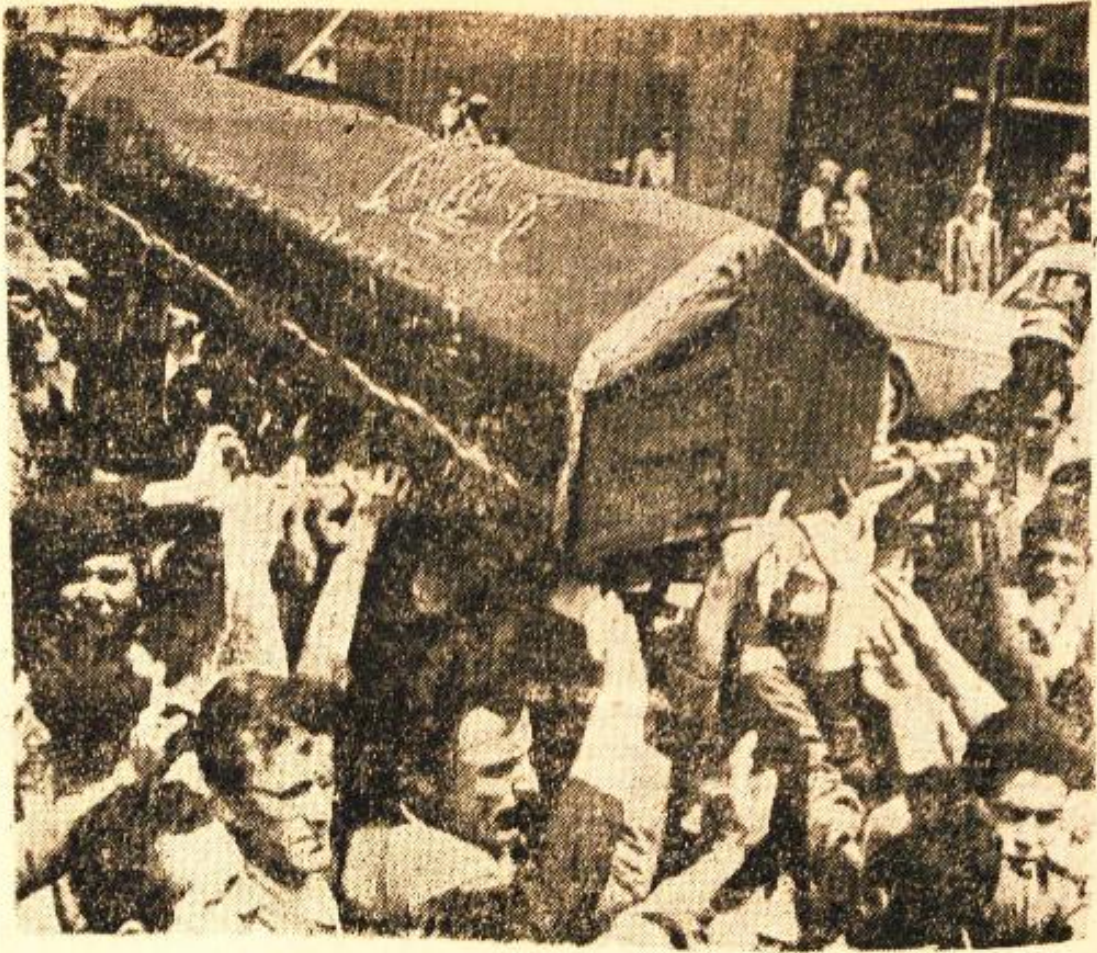
D. Safa istirahatgâhına götürülüyor